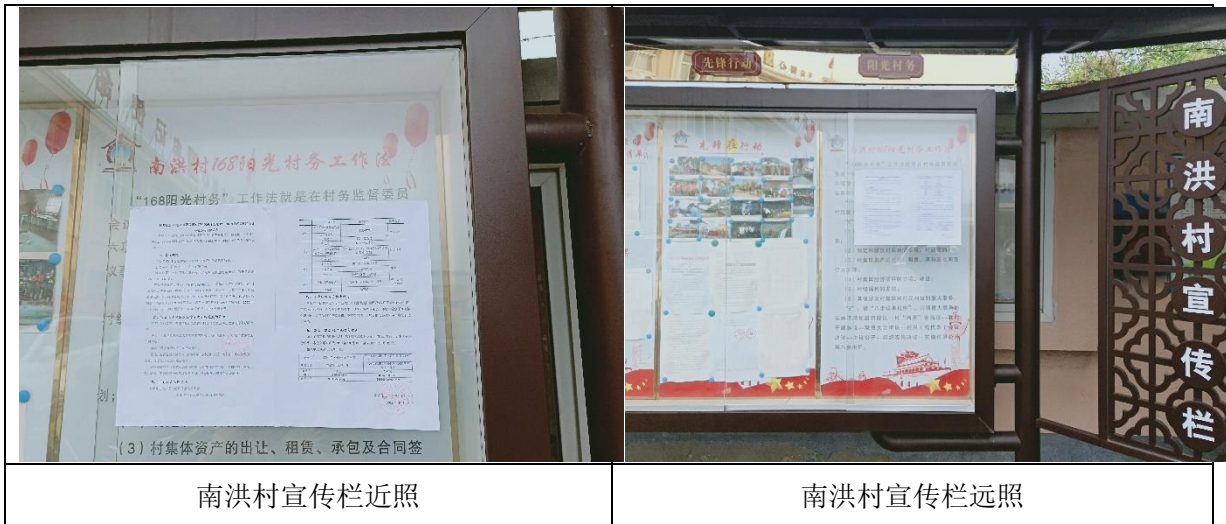
南洪村宣传栏近照